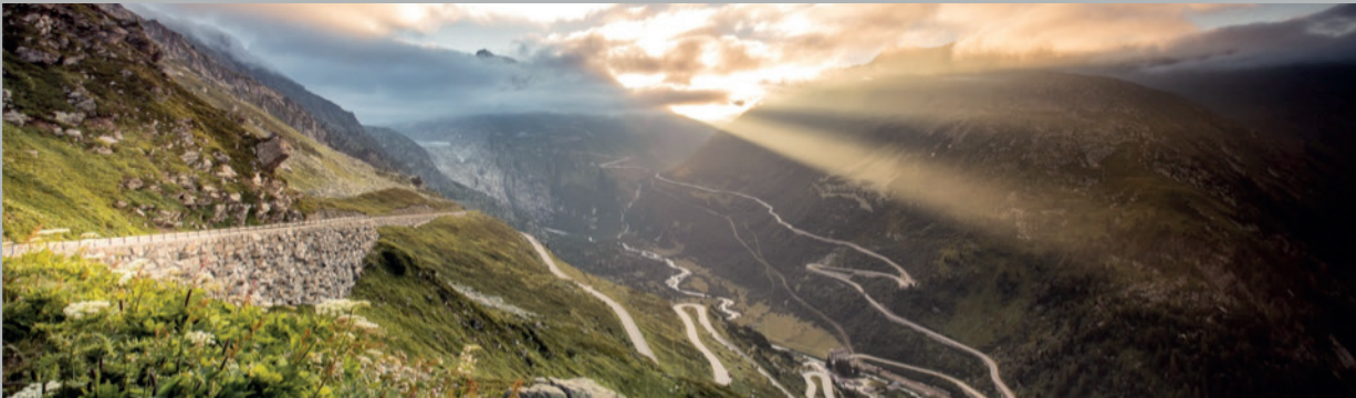
Beinah alle Wege führen ins Obergoms

In unserem kleinen Theatersaal bringen wir jeweils rund 30 Aufführungen im Winter über die Bühne. Diesen Winter können wir einen schönen Erfolg mit „Wehe, wenn sie losgelassen“ feiern.